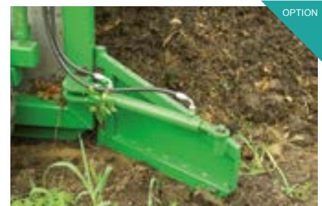
Hydraulisches Zuführschild rechts