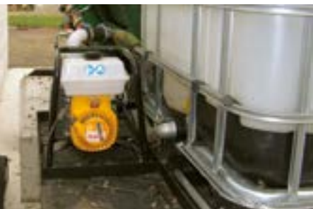
Die Wender sind so konzipiert, dass auch eigene Wasserpumpen montiert werden können.