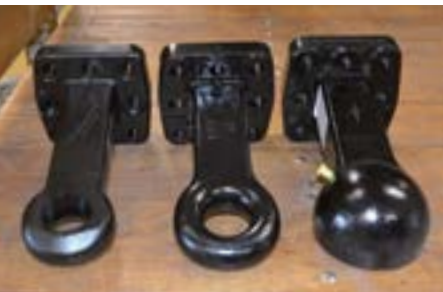
DIN (Serie) Piton K80