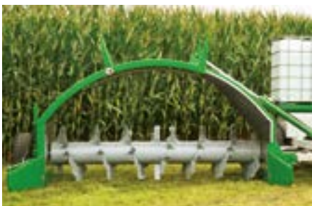
Die massive Bogenkonstruktion aus 6 mm Stahl sorgt für eine sehr grosse Stabilität.