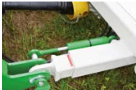
Hydraulische Seitenversatzung, damit die Miete da bleibt, wo sie hingehört.