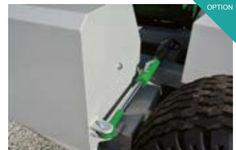
Seitengewicht hydraulisch schwenkbar