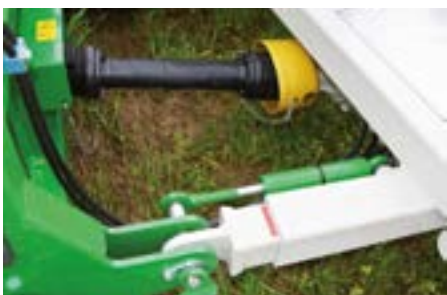
Direkter Antrieb – Getriebe auf Umsetzwelle