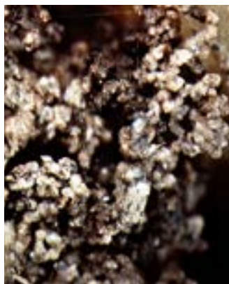
Perfekter Krümelaufbau – mikroskopische Ansicht

Zudem speichert ein humusreicher Boden auf natürliche Weise CO 2 und schützt somit unser Klima.