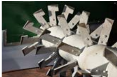
Eine gute Umsetzwelle arbeitet das Material von innen nach aussen, damit die Mikroorganismen sich überall optimal vermehren können.