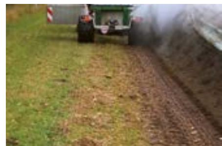
Dank dem Schwenkgewicht ist auch das Befahren einer Wiese möglich. Ausserdem sorgt es für eine optimale Gewichtsverteilung und verringert das Gesamtgewicht um ca. 1'500 kg.