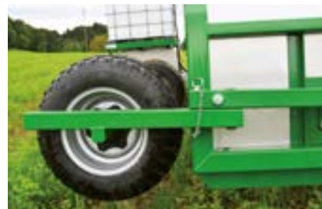
Für den Transport kann das Tastrad weggeschwenkt werden, keine Demontage nötig.