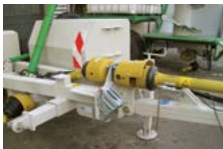
Untenanhängung für Tiefzug für Hitch mit Piton oder K80.