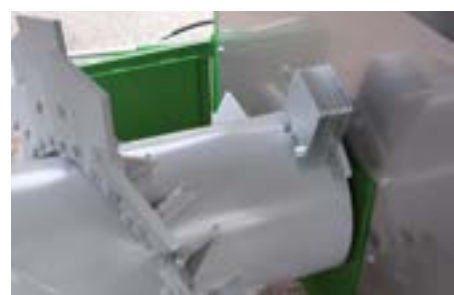
12 mm Schlägerdicke mit 3 Befestigungsschrauben. Die gewuchtete Welle sorgt für eine lange Lebensdauer.