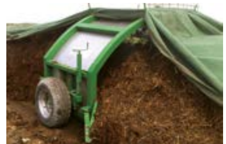
Das Vlies wird auf schmale Breite zusammengeführt, damit die Gase entweichen können. Die schwere Handarbeit bei nassem Vlies entfällt.