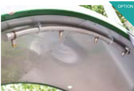
Wasserspritzbalken mit Düsen. Für die Erreichung eines optimalen Mikroorganismus-Klimas innerhalb der Miete ist die Zugabe von Wasser unerlässlich.