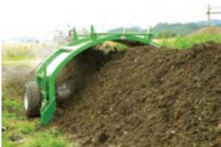
Maximale Mietengrösse: 3 x 1.5 m, damit aerob kompostiert werden kann.