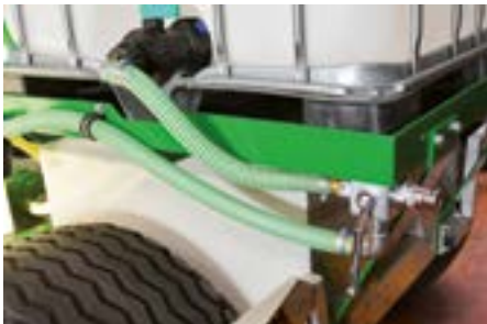
Externe Wasseransaugmöglichkeit für Fremdansaugung.