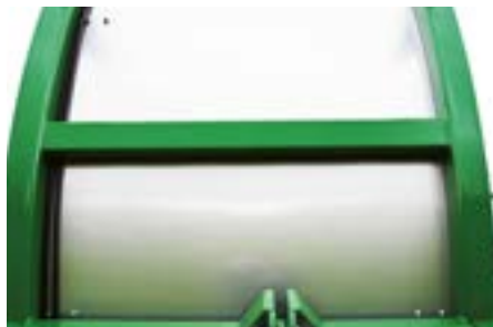
Alle Verschleissbleche sind aus Chromstahl.