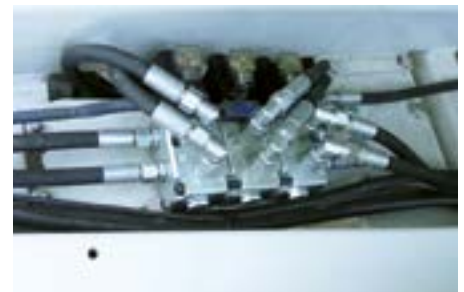
Elektrohydraulische Ventilbank mit Bedientpult (einfach, zweifach oder dreifach)