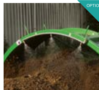
Bewässerung mittels Wasserspritzbalken. Für die Erreichung eines optimalen Mikroorganismus-Klimas innerhalb der Miete ist die Zugabe von Wasser unerlässlich.