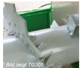
Bild zeigt TG301

12 mm Schlägerdicke mit 2 Befestigungsschrauben. Die gewuchtete Welle sorgt für eine lange Lebensdauer.